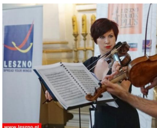
Przykładowe wykorzystanie bramy pneumatycznej i roll-up'u