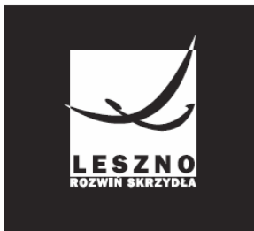
Logo na ciemnym tle